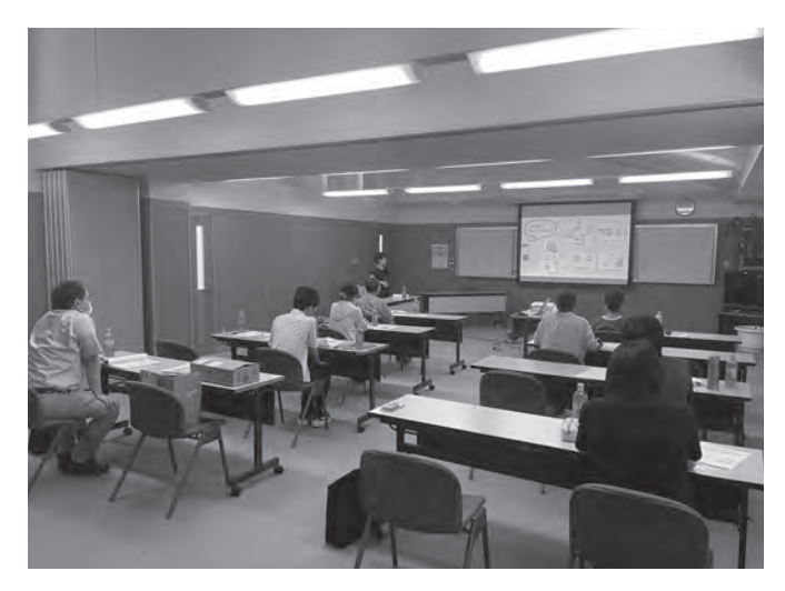
8/2 ボランティア養成研修 蓬田村ふるさと総合センター