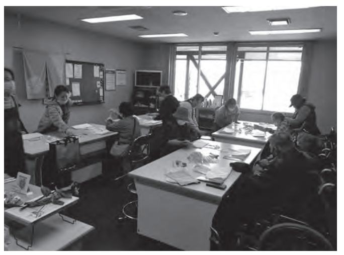
10/24 蓬田村身体障害者福祉会 「秋の野外研修」 板柳町ふるさとセンター