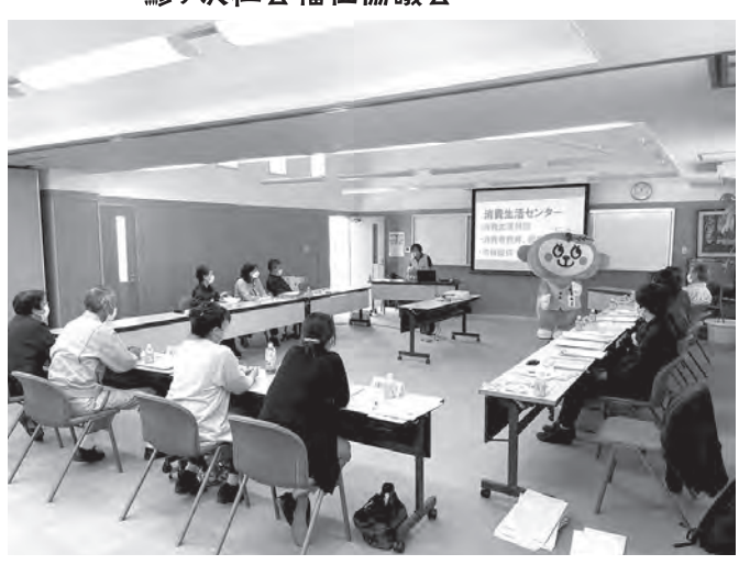
10/11 民生委員児童委員協議会研修会 「最近の悪質商法の手口と対処法のポイント、 地域の見守りについて」 蓬田村ふるさと総合センター