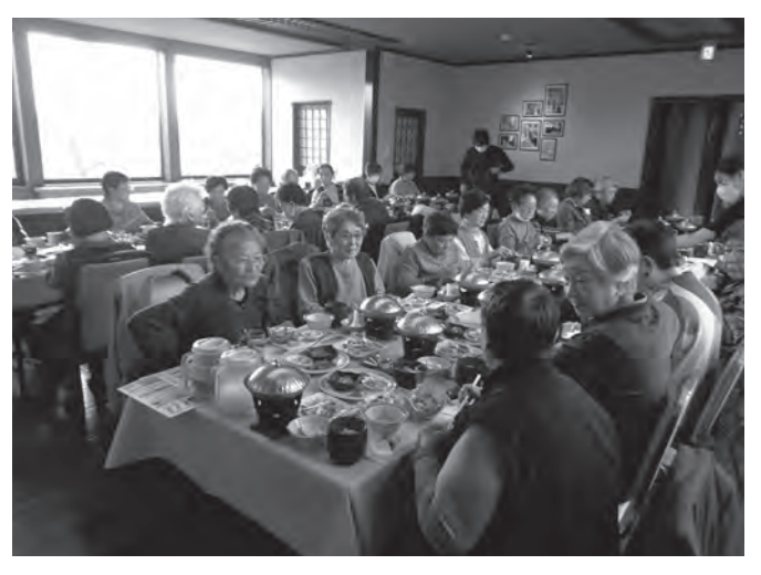
10/25 東郡母子寡婦福祉連合会交流会 津軽おのえ温泉日帰り宿「福家」