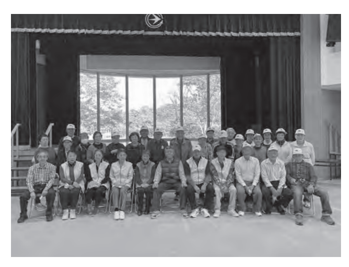
10/6 大野シニア元気クラブモルック交流会 蓬田村ふるさと総合センター