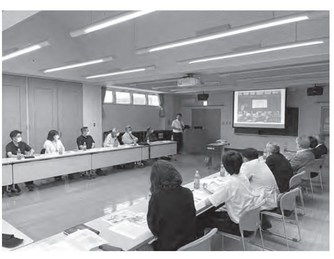
9/21 東郡ブロック研修 「令和4年8月豪雨災害 ボランティアセンター活動報告」 鯵ヶ沢社会福祉協議会