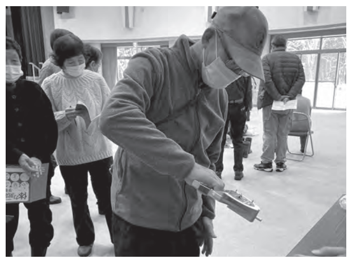
12/22 ボランティア交流会 「体力測定と活動報告」 よもぎ温泉