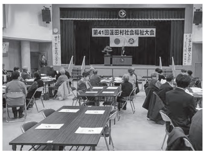
11/29 蓬田村社会福祉大会 蓬田村ふるさと総合センター