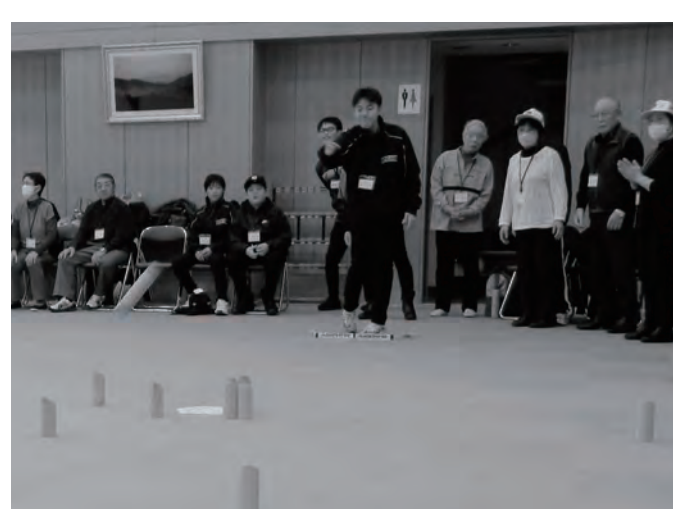
1/20 モルック交流会with青森大学 蓬田村ふるさと総合センター