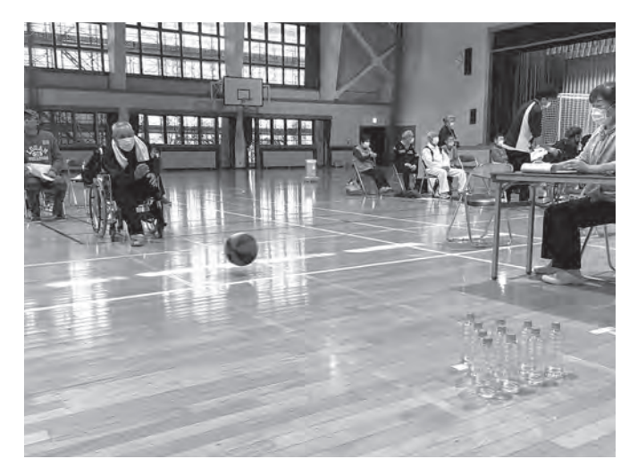
10/12 東郡身体障害者福祉会 「レクリエーションの集い」 蓬田村トレーニングセンター